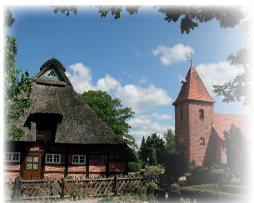
Küsterhaus mit St. Johannes Kirche Schwanewede