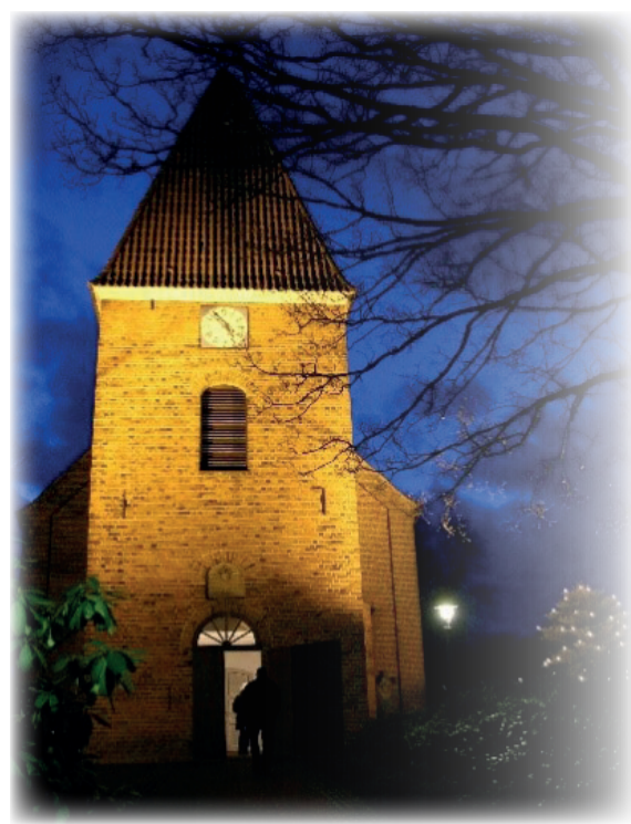
St. Luciae Kirche Meyenburg

Meyenburg ist ein idyllisches Dorf zwischen Marsch und Geest nahe der Weser. Die bezaubernde Stadt Bremen mit ihren kulturellen Angeboten ist ebenso schnell erreichbar wie die Nordsee mit dem