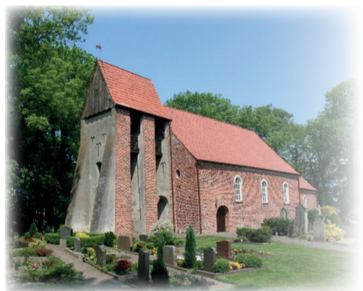
St. Nikolai Kirche Bruch-Aschwarden

Meyenburg bietet Kinderbetreuung von der Krippe über den Kindergarten bis zur Grundschule. Weiterführende Schulen finden sich in Schwanewede (7 km). Ebenso bietet Meyenburg eine haus-