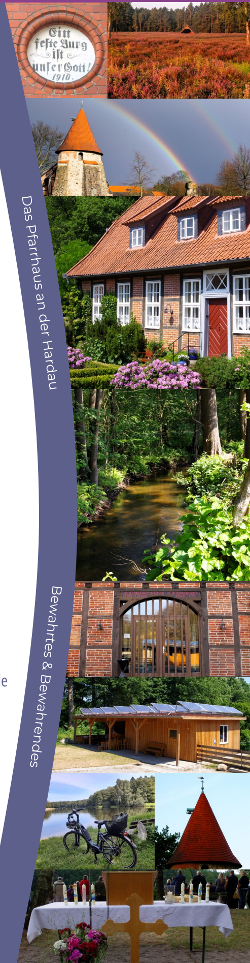
Das Pfarrhaus an der Hardau