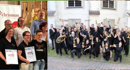
St. Remigius Suderburg