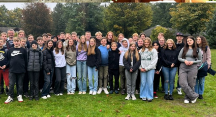
St. Nicolai Holdenstedt