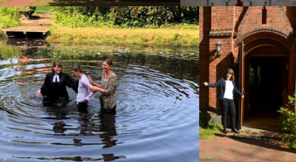
St. Michaelis Gerdau